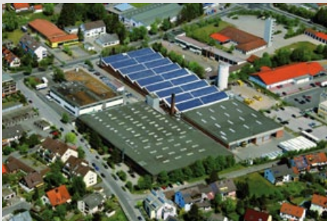
Der AICHINGER-Hauptsitz mit Werk