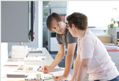
Individuelle Planung bis ins Detail