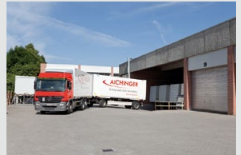
Qualifizierte Montage & zuverlässiger Service