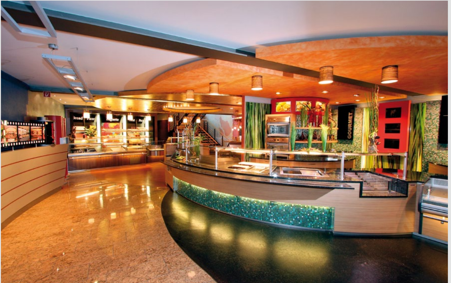
Der AICHINGER-Showroom in Wendelstein bei Nürnberg – Qualität zum Anfassen.