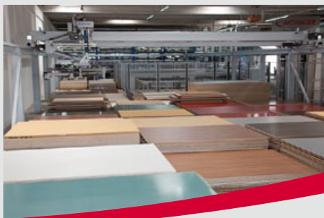
Modernste Produktionsanlagen und erfahrene Mitarbeiter für Qualität „Made by AICHINGER“